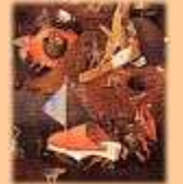
Jérôme Bosch - Le Jugement Dernier (détail)

Visite à ne pas manquer, le musée est à dimension humaine de par sa taille raisonnable.